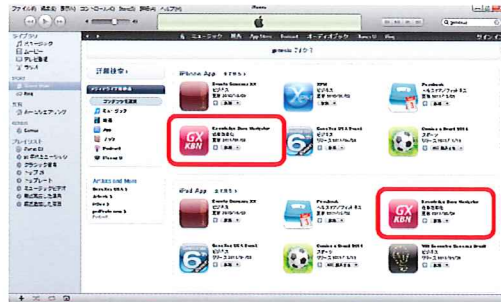
【ナレッジベースナビゲータ (iOS版)】

スマートデバイスジェネレータでの各種開発経験がある弊社が貴社のお手伝いをさせていただきます。